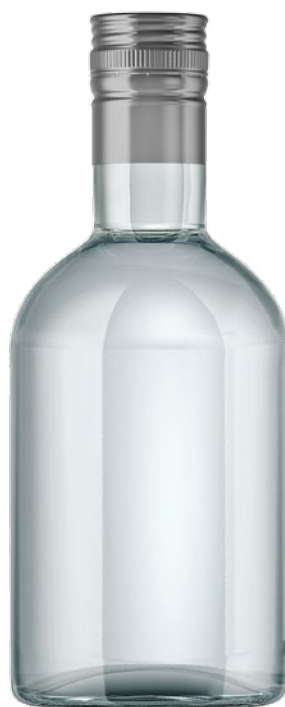
BUTELKA 500 ML WZÓR NR 2 „PRESTOLNA”