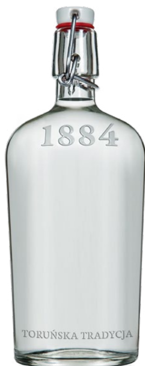
BUTELKA 500 ML WZÓR NR 1 „1884”